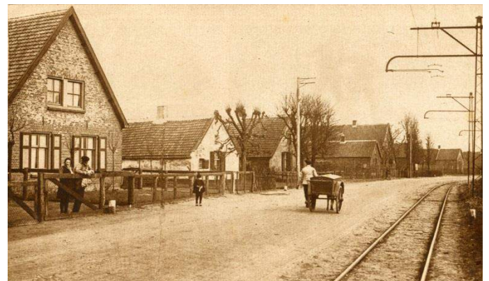
De Vordel in 1928. Is er nog iemand die weet wie er op deze foto staan afgebeeld? Laat het ons weten!

Tot ver in de 19e eeuw bestond het driehoekige gebied van de Vordel vrijwel geheel uit bos. Het was sinds de 17 e eeuw bezit dat toebehoorde aan opeenvolgende Graven van Athlone, eigenaren van het kasteel Amerongen. In de tweede helft van de 19e eeuw verkocht deze familie lange kavels vanaf de Rijksstraatweg tot aan Zwijnsbergen (toen nog Franscheweg) aan particulieren en werd de Vordel langzamerhand ontgonnen. Huizenbouw vond voornamelijk plaats aan de Rijksstraatweg en pas later verschenen er huizen aan het deel van de Franscheweg dat nu Zwijnsbergen is. Vroeger lag deze weg gedeeltelijk op het grondgebied van Plantage Willem III, maar werd later door de Gemeente Rhenen aangekocht. De Vordel was vroeger veel groter dan nu. Tot de aanleg van Plantage Willem III liep de weg die we nu als Zwijnsbergen kennen wat verder door richting Remmerden. Men noemde het gebied ten oosten van de huidige Vordel de Kerken Vordel van Rhenen. Dit komt omdat dit gebied toen eigendom was van de Rhenense kerk. Bij de ontginning van Plantage Willem III is dit stukje Vordel op den duur verdwenen. Het gedeelte richting Elst noemde men de Vordel van de Grave van Athlone. Bewoners van dit gebied woonden en wonen nog steeds in ‘de Vorrel’ om het maar eens op z’n Elsters te zeggen.