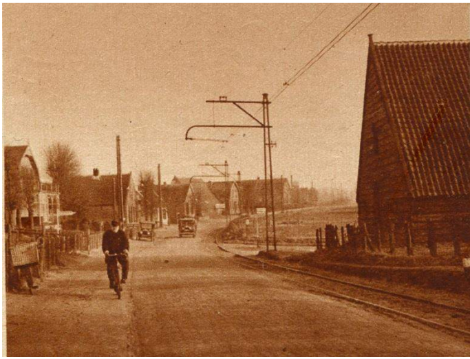
De Rijksstraatweg ter hoogte van de Ingenseveerweg in 1930. Op deze foto is te zien dat de weg verderop richting Rhenen weer omhoog loopt. Het gebied ten oosten van de Veerweg werd de Scheur genoemd. Aan de noordzijde van de Rijksstraatweg lag de Scheureng.